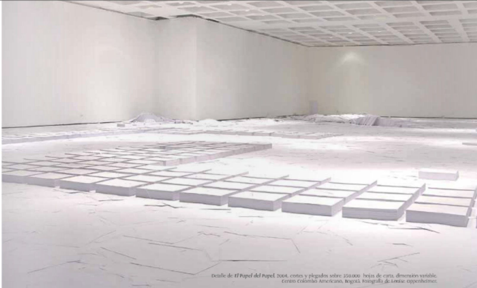
Detalle de El Papel del Papel , 2004, cortes y plegados sobre 350.000 hojas de cartón, dimensión variable. Centro Colombo Americano, Bogotá.

La obra es una lata vacía y la lata tampoco importa. Lo único que se ofrece es una pausa envasada: la ceremonia de abrir lentamente la lata lleva al observador a hacerse cargo del vacío: el observador es contenido. Mi única intención es hacer visible el tiempo. Frenar hasta hacer posible una segunda realidad donde no nos multen por estacionar ni nos denuncien por prestar atención. Actualmente focalizarse es considerado como una actividad subversiva.